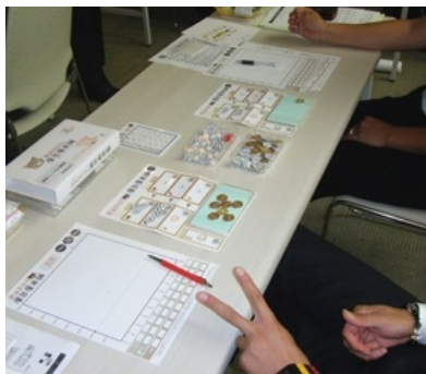
「講座内容3番」を学んでいる様子

1979年福井県生まれ。愛知学院大学経営学部卒。大学卒業後、起業を志しITベンチャー企業に営業職として就職。その後、愛知県で広告制作会社を設立する。広告制作業の傍ら、創業の体験を元に父の開発した経営ゲーム「屋台屋本舗」を使った創業支援セミナーの講師を始める。現在、経営ゲームの製作・販売業務と共に、商工団体等でゲームを活用した創業塾やセミナーの講師として活躍中。他に類の無いゲームボードは画期的な研修ツールとして多方面から注目されている。